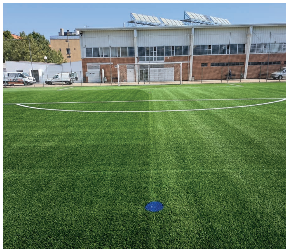
Anexo realizado al edificio de vestuarios

para la creación de una sala polivalente. Estos trabajos han consistido en el levantamiento de un cerramiento de ladrillo sobre un zuncho perimetral y la ejecución de una cubierta, además se ha dotado de tomas de abastecimiento y evacuación de agua para la instalación de lavadoras, así como la instalación eléctrica necesaria para la sala.