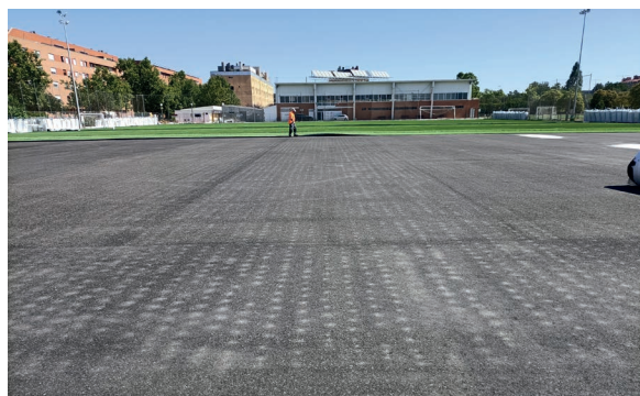
Campo fútbol 11, instalación del nuevo césped artificial

Posteriormente, se ha procedido a la instalación del césped artificial, el material elegido es de última generación para la práctica de fútbol fabricado mediante sistema Tufting , con filamentos en verde bicolor de 60 mm de altura y con distintos tipos de fibras monofilamento fabricados en polietileno, con una excelente resistencia a la abrasión y a los rayos ultravioletas. Estos monofilamentos están unidos al soporte primario mediante un sistema de doble tuftado y una resistencia al arranque superior a 100N. Para asegurar la estabilización del césped y la elasticidad de la base, se han utilizado rellenos con arena de sílice y caucho granulado SBR, reutilizando una parte de los rellenos retirados de los anteriores campos para minimizar la retirada a vertedero de este material.