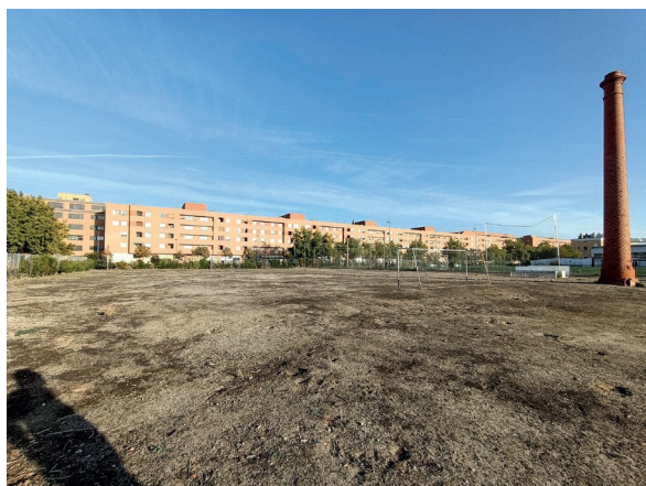
Campo fútbol 7, estado previo a las obras

El campo de fútbol 7 de aproximadamente 3.400 m 2 era un campo de tierra en desuso debido al mal estado en que se encontraba, se ha acondicionado la subbase para poder reutilizar el césped artificial del campo de fútbol 11 y la empresa adjudicataria nos ha gratificado reutilizando el césped artificial del campo de fútbol 11.