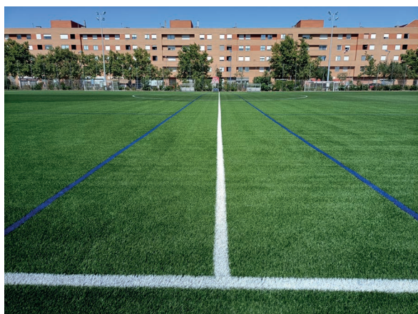
Marcaje del campo de fútbol 11

Además, ambos campos de fútbol han sido marcados y señalizados siguiendo los criterios de la FMD y reglamentación de la Real Federación Española de Fútbol.