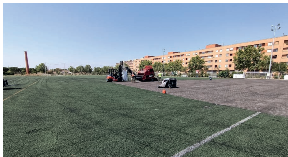
Campo fútbol 11, trabajos de desmontaje

Las primeras actuaciones realizadas por la empresa fueron el desmontaje de porterías, banquillos y postes para el correcto desarrollo de los trabajos, retirada por medios mecánicos específicos de la capa de césped artificial de manera ordenada para su reutilización, extracción del material de relleno, limpieza de la subbase asfáltica, reparación de las imperfecciones en la solera y revisión de las canalas de recogida de pluviales.