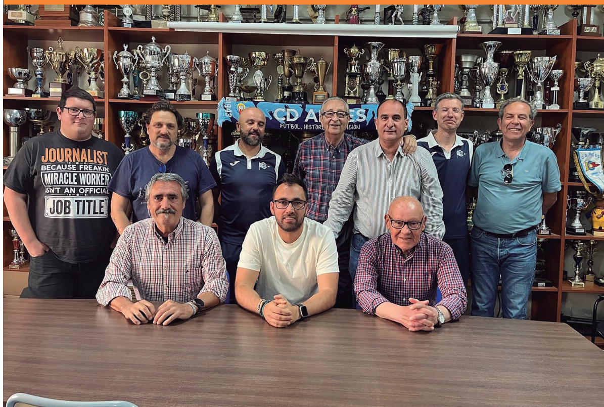
Miembros del jurado XVIII edición PREMIOS DOMINGO CABALLERO.

E l Club Deportivo ARCES creó en el año 2005 el premio Domingo Caballero como reconocimiento a su fallecido presidente dos años antes, y nace con la intención de galardonar la labor directiva de aquella persona que en su gestión al frente de la dirección o gerencia, siempre en el contexto del deporte base, deporte inclusivo, escolar y aficionado, en la provincia de Valladolid, en clubes, asociaciones, fundaciones y federaciones, destaque por sus valores de responsabilidad, compromiso, dedicación, generosidad, altruismo, honestidad, cortesía, lealtad y nobleza, pero sobre todo su «caballerosidad», valores todos ellos en los que destacó quien fuera nuestro presidente.