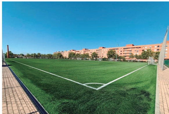
Campo fútbol 11, finalización de los trabajos

Finalmente, se ha realizado el montaje del equipamiento deportivo existente sobre el nuevo pavimento. Adicionalmente, como mejoras de esta contratación, se han renovado las redes parabalones del lateral del campo colindantes a la calle Santa María de la Cabeza, y a la reinstalación de parte del césped retirado en el antiguo campo de tierra existente junto al campo de fútbol 11, previo desbroce, limpieza y nivelación de la subbase.