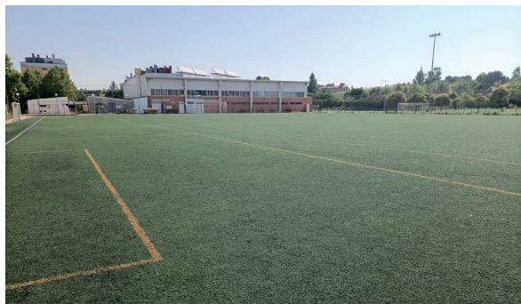
Campo fútbol 11, estado previo a las obras

El campo de fútbol 11 tiene una superficie de césped artificial de 7.450 m 2 y su última intervención fue en el año 2007, debido a su estado actual la Fundación Municipal de Deportes valoró realizar una mejora en esta instalación para su adecuada utilización. Se procedió a gestionar un expediente de contratación, y el adjudicatario de estas obras ha sido Obras y Pavimentos Especiales S.L.