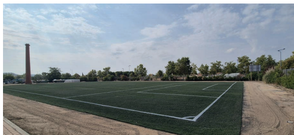
Campo fútbol 7, finalización de los trabajos

Además, ambos campos de fútbol han sido marcados y señalizados siguiendo los criterios de la FMD y reglamentación de la Real Federación Española de Fútbol.