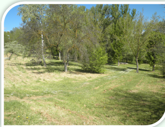
VEGETACIÓN DE RIBERA