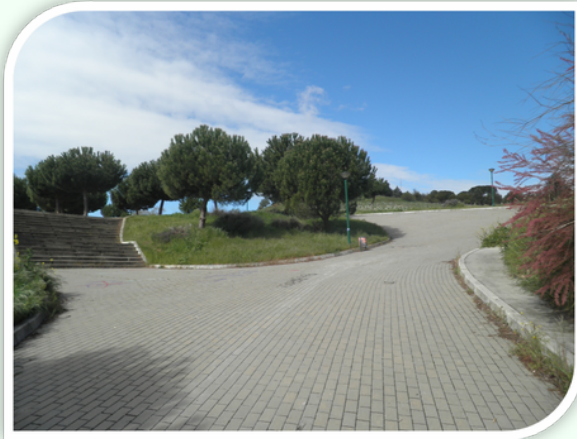
PINO PIÑONERO Y CARRASCO