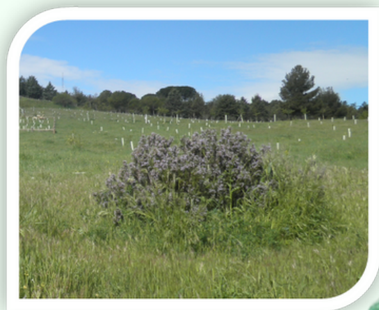
MATORRAL Y AROMÁTICAS